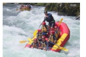
[こんな瀬が4カ所もある]